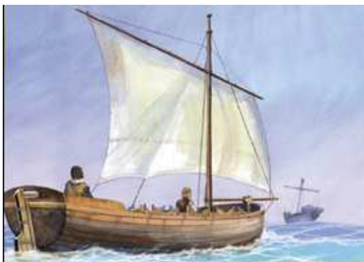
Chalupa a vela medieval

Fuera del ámbito Chiloé-Guaitecas, las chalupas más conocidas son las medievales, también las que van como nave auxiliar dentro de un buque.