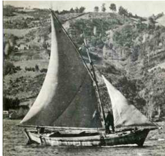
Chalupón Guaitequero, años 70 Anexo C.i.

La chalupa a vela es el medio a través del cual se posibilitó el poblamiento de Melinka, representa el arrojo con que sus predecesores que viajaban a las Guaitecas para la explotación de los recursos, se fueron asentando. Existe además admiración por el arte de la navegación a vela y el conocimiento sólo por experiencia, de la geografía, las mareas, los puertos y todos los detalles del archipiélago. Hoy la navegación es a motor, en embarcaciones generalmente con cabina y con instrumentos de navegación.