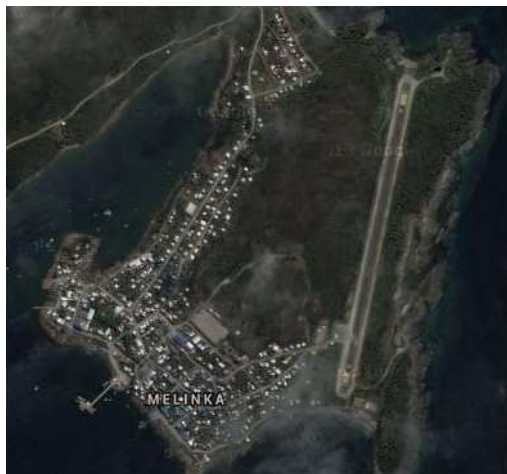
Google Maps 2013

A continuación se presenta el listado georeferenciado 2 de cultores/as y festividades de Melinka en relación a la construcción – navegación en chalupa a vela: