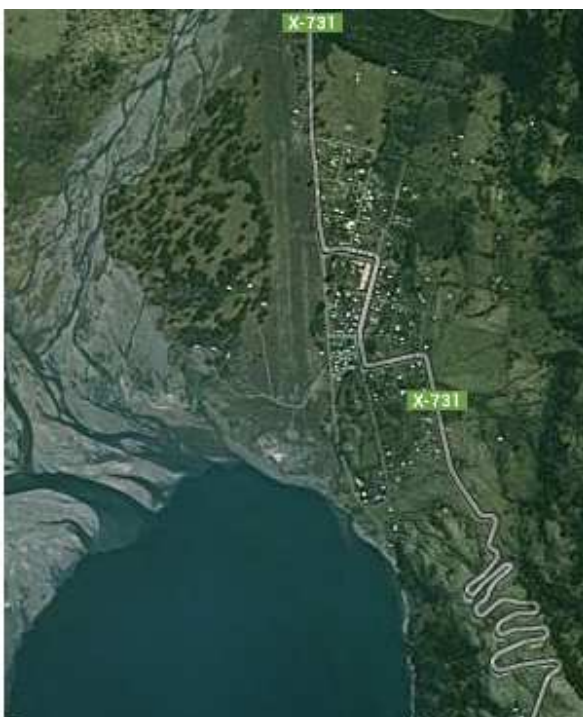
Bahía Murta, Río Ibáñez, Aysén, Chile (Google Maps)

Bahía Murta (46°28'0" N y 72°43'0") es parte de la comuna de Río Ibáñez, se encuentra a en dirección sur y a 203 km. de la capital regional, Coyhaique, junto al Lago General Carrera y en la desembocadura del río Murta y el río Resbalón, es un sector de variada flora y fauna nativa, de grandes bosques frondosos (I. Municipalidad de Río Ibáñez, Web, 2013).